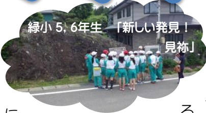
緑小5,6年生「新しい発見！見物」

「子ども」にも出合えるようになってきました。ジオパーク学習は、実験やクイズを交えて、教室で学習したり、教室で見聞きたことを実際にその場所へ行って体感する充実した学習スタイルを設定しています。