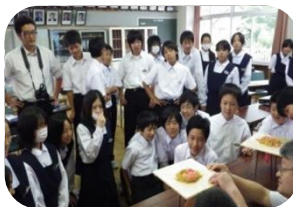
「火山専門家の実験を共に学ぶ」 吾妻中学校1年生

「子ども」にも出合えるようになってきました。ジオパーク学習は、実験やクイズを交えて、教室で学習したり、教室で見聞きたことを実際にその場所へ行って体感する充実した学習スタイルを設定しています。