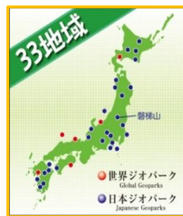
【現在 33 地域のジオパークが日本にあります】

ジオパークとは、身の回りの山や川などの地形とそれを形作っている岩石や地層を通して、地球の活動や大地の成り立ちを知ることができる“大地（ジオ）の公園”です。また大地の上で育まれた生態系（動物や植物など）や人々の歴史・文化さらに地元の特産物や郷土料理、そして温泉、大地と大地上の全てのものの