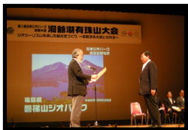
第3回・日本ジオパーク全国大会 in 洞爺湖有珠山にて、磐梯山ジオパーク協議会長（北塩原村長）に日本ジオパーク認定証が授与された。（2011年9月） （当協議会の副会長は、猪苗代町長、磐梯町長）

磐梯山ジオパークは、この日から磐梯山のすばらしさを世界に発信し、ジオパークの魅力を巡るジオツアーを中心とした観光を推進し、学校教育や住民向けの普及活動を進め、地域の持続的な発展につなげていく活動をはじめました。