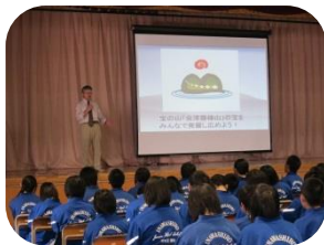
「ジオパークの時間」 猪苗代中学校全校生

住民の皆様在所へも、事務局へお電話一本でご相談の上、「新鮮な」ジオパークの出前をお届けいたします。