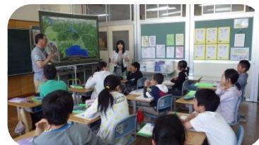
吾妻小5年生「自分たちのジオ」

は、「今年もジオパークの時期が来た！一年生、勉強するんだよね。」と三年生の生徒さんからジオパークが浸透してきたと思える嬉しい声が事務局に聞かせてきました。